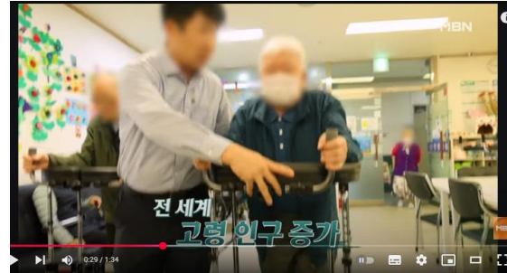
특집다큐H <글로벌 뇌 과학 전쟁 뇌 질환을 막아라> MBN 250621 방송